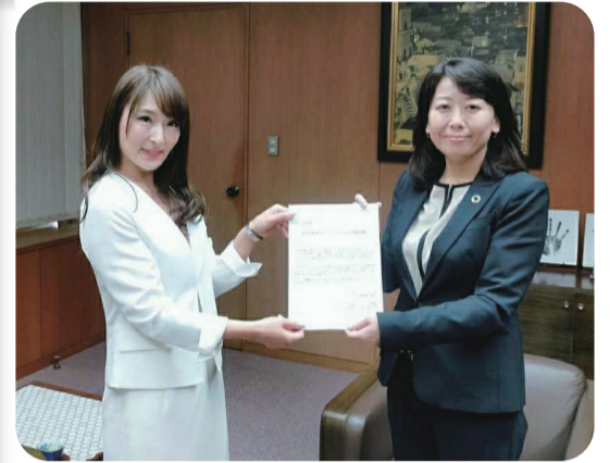
11月29日、2022年度予算要望書を太田市長に届けました。