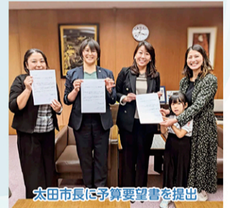
太田市長に予算要望書を提出

大変な作業ですが、要望を言い放しにせず見守る大事な活動です。予算要望書づくりに関心のある方は、ぜひご連絡ください。